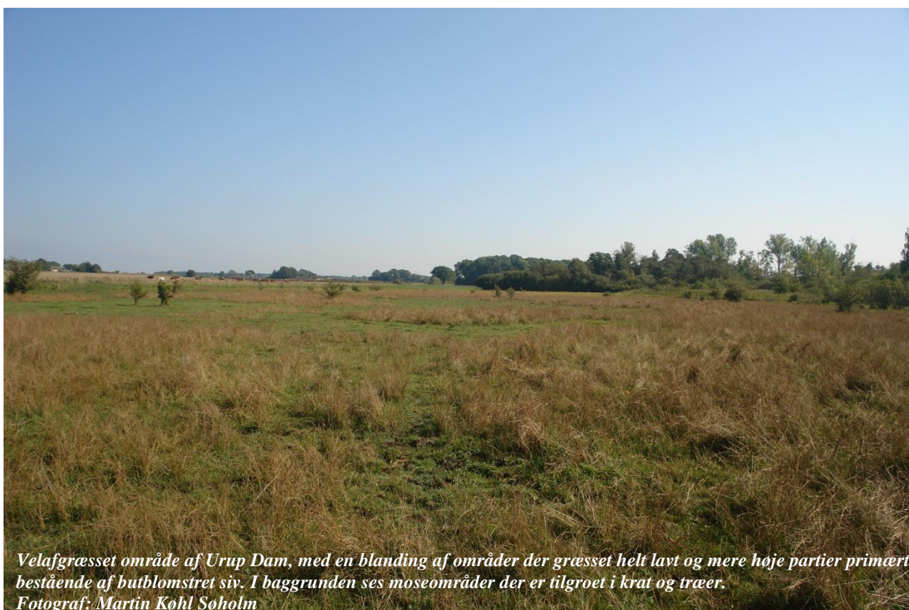
Velafræsset område af Urup Dam, med en blanding af områder der græsset helt lavt og mere høje partier primært bestående af butblomstret siv. I baggrunden ses moseområder der er tilgroet i krat og træer.

De væsentligste naturforvaltningsmæssige opgaver i området er forsat sikring af hensigtsmæssig drift/pleje på de sammenhængende rigkær, så der sikres tilstrækkelige store levesteder for mygblomst.