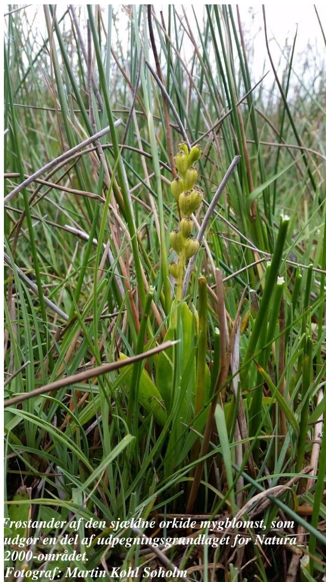
Frøstander af den sjældne orkide mygblomst, som udgør en del af udpegningsgrundlaget for Natura 2000-området.

Indsatsen udføres af lodsejere i området og gennemføres i videst muligt omfang gennem frivillige aftaler. Der findes blandt andet en række tilskudsordninger, som kan søges gennem NaturErhvervstyrelsen.