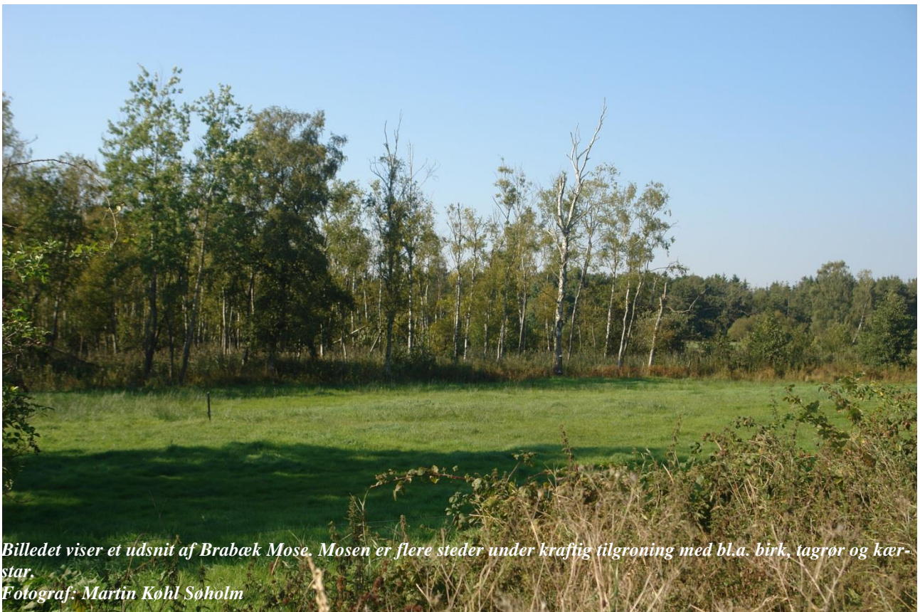
Billedet viser et udsnit af Brabæk Mose. Mosen er flere steder under kraftig tilgroning med bl.a. birk, tagrør og kærrstar.